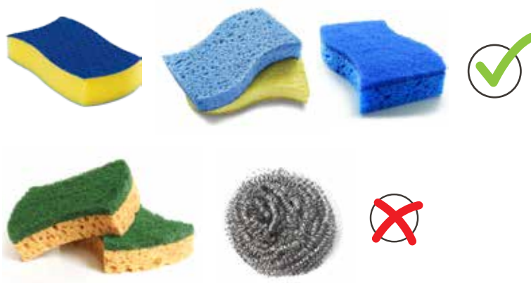
Éponges domestiques qui peuvent ou ne peuvent pas être utilisées avec TagTough.

Pour en savoir plus sur la bonne méthode de nettoyage à utiliser, vous pouvez visionner une vidéo de démonstration à https://www.youtube.com/watch?v=k2WMOgPGHGU&feature=youtu.be .