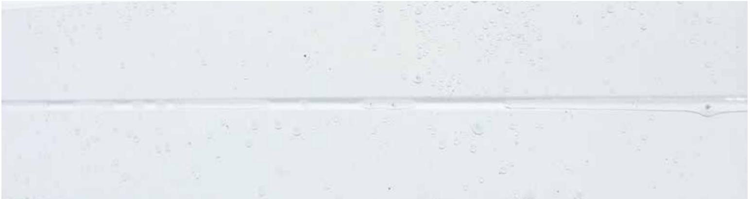
Après le frottage manuel avec une éponge à récurer domestique (étape 2)

Avis de non-responsabilité : ArcelorMittal Dofasco a évalué l'acier TagTough en utilisant divers marqueurs et peintures à pulvériser commerciaux et non commerciaux généralement utilisés pour faire les graffitis. Bien que la majorité des matériaux utilisés pour faire des graffitis puissent être enlevés en suivant les méthodes de nettoyage recommandées, certains de ces produits peuvent laisser une légère marque (permanente) sur la surface. Les renseignements inclus dans le présent document sont offerts à titre purement indicatif et n'entraînent aucune responsabilité autre que celle exposée dans la fiche de données techniques Spécifications de qualité et de performance, le cas échéant.