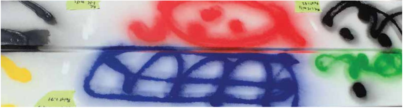
Avant le lavage sous pression et 72 heures après l'application du graffiti